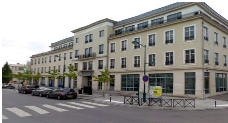
IFIS/Bâtiment ERASME 6-8, cours du Danube 77700 Serris

En cas de problème / In case of trouble :